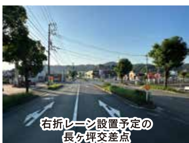
右折レーン設置予定の長ヶ坪交差点