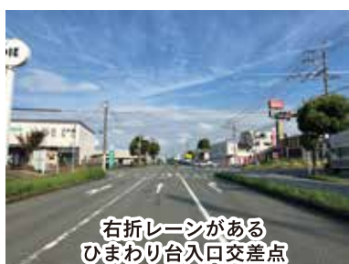
右折レーンがあるひまわり台入口交差点

や縁石工などの工事に着手する予定となっております。右折レーン工事が今年度着工し、令和8年度完成予定です。