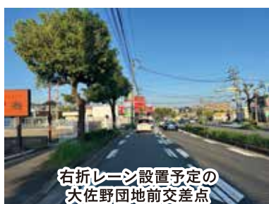
右折レーン設置予定の大佐野団地前交差点

交通事故の緩和とため、大佐野台団地前交差点と長ヶ坪交差点に右折レーンを設置する事業が進んでいます。 今年度から、排水工