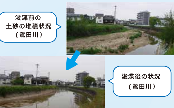
浚渫前の土砂の堆積状況(鷺田川)

西鉄二日市駅へのアクセス向上や、歩行者や自転車の安全な通行を確保のため、国道3号の都府楼橋交差点から西鉄二日市駅に向かって約600mの区間について、1車線を2車線に拡幅し、両側に歩道を設置する事業が進んでいます。 地域の皆さまの協力のもと、用地の取得が進んでおり、今年度も、引き続き、用地の相談を進める予定となっています。